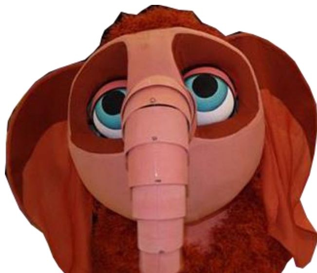
Moti, le petit Mammouth

La taille des personnages est respectée (le morse ou le requin sont plus grands que le singe ou le toucan, etc...) afin de garder une cohérence d'échelle avec les décors virtuels.