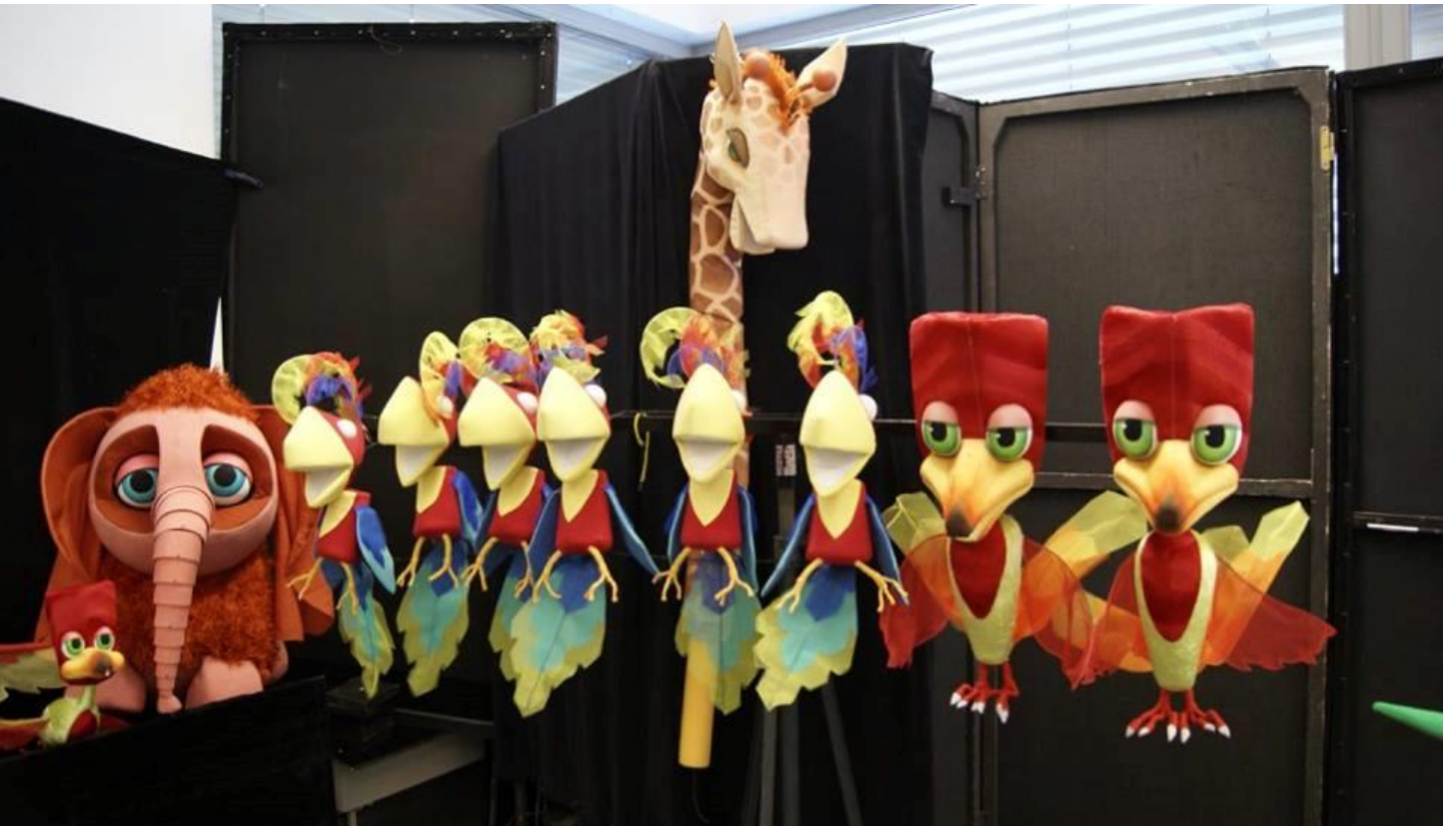
Dossier de présentation - L'odyssée de Moti Théâtre de Marionnettes de Belfort