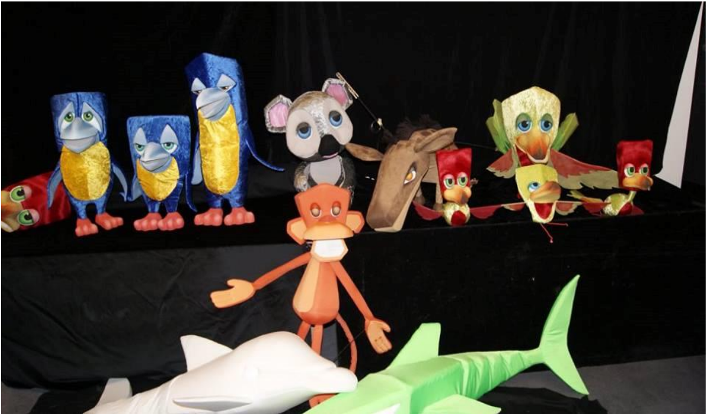
Quelques personnages de L'Odysée de Moti