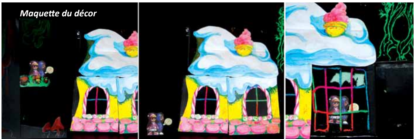
Maquette du décor